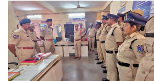
డిప్యూటీ కమిషనర్ ఆఫ్ పోలీస్ నారాయణ రెడ్డి

మాట్లాడు, మే 19, ప్రభాతవార్త: రైతులకు ఇబ్బందులు లేకుండా ధాన్యం కొనుగోళ్లు నిర్వహించాలని డిప్యూటీ కమిషనర్ ఆఫ్ పోలీస్ నారాయణ రెడ్డి అన్నారు. మంగళవారం ఇబ్బందపట్టుం డివిజన్ ఆఫీస్ లోని కమిషనర్ ఆఫ్ పోలీస్ రాజు కలిసి మండల పరిధిలోని ప్రాథమిక వ్యవసాయ సహకార సంఘంలో ఏర్పాటు చేసిన వడ్ల కొనుగోలు కేంద్రాన్ని ఆయన సందర్శించి రైతుల కోసం కల్పిస్తున్న సౌకర్యాలను పరిశీలించారు. ఈ సందర్భంగా సంబంధిత సంస్థల అధికారులతో మాట్లాడిన డి.సి. రైతులకు తాగునీరు, కూర్చునే ఏర్పాట్లు, నీడ, పారిశుధ్య సదుపాయాలు, పరిశుభ్రత, బోకెస్ వంటివి, ధాన్యం తూకం వంటి అంశాలను సక్రమంగా నిర్వహించాలని ఆదేశించారు. రైతులు ఇబ్బందులు పడకుండా క్యూలైన్లను క్రమబద్ధంగా నిర్వహించాలని సూచించారు. ధాన్యం కొనుగోలు ప్రక్రియలో పారదర్శకత పాటించాలని, రైతుల ఫిర్యాదులను వెంటనే పరిష్కరించాలని తెలిపారు. కొనుగోలు కేంద్రాల వద్ద శాంతి భద్రతలు కాపాడడంలో పాటు మధ్యవర్తులు అవుతూ జోక్యాన్ని అరికట్టాలని అధికారులను ఆదేశించారు. బ్రాఫిక్ సమస్యలు తరిగిపోతూ స్థానిక పోలీసులతో