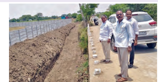
పాటు కాలవకడంగా నిమెంబి పలకలు వేసిన ప్రదేశాన్ని పరిశీలిస్తున్న మాజీ ఎమ్మెల్యే

డివిజన్ పోలీస్ బ్యారో సభ్యులు బళ్ళని సర్పించి హెచ్చరిక నందిగామ, మే 19, ప్రభాతవార్త : ప్రత్యేక సిద్ధమైన పనరులకు అటంకం కలిగిస్తే మానవ ముసగడ ప్రశ్నార్థకమవుతుందని పార్లమెంట్ మాజీ ఎమ్మెల్యే, డివిజన్ పోలీస్ బ్యారో సభ్యులు బళ్ళని సర్పించి అన్నారు. మంగళవారం నందిగామ మండలం మొదలగూడెంలోని సర్వేనెంబర్ 292 భూముల్లో ఆక్రమణకు గురైన సీటి పరివాహ ప్రదేశాలను పరిశీలించారు. సర్కారు భూములను చౌకగా తీసుకొని న క్షణబులను, కాలవలను, కుంటలను ధ్వంసం చేస్తూ రోజుల్లో భారీ పడ గురయ్యే ప్రమాదం ఉందన్నారు. గతంలో డివిజన్ హయాంలో పాటు కాలవలు, చెక్ డ్యాములు నిర్మించిందని, జన్యుభూమి, ప్రజల