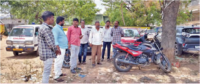
ఫల పంపిణీ చేస్తున్న మున్సిపల్ ఛార్జీ పత్తనాయక్