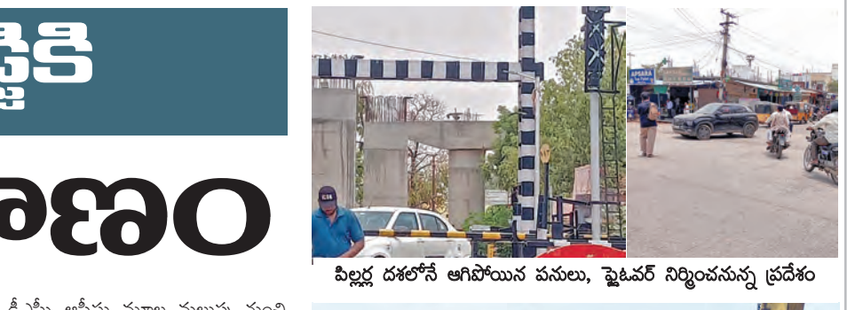
పిల్లల దళాల్లోని అగిరియిన పనులు, షేడీవర్ నిర్మించనున్న ప్రదేశం