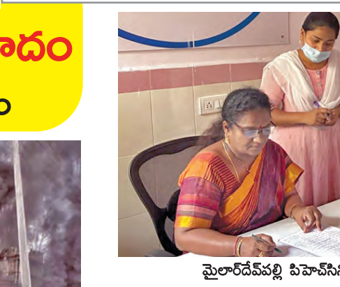
మైలారదీపట్ల పిహెచ్సీని తనిఖీ నిర్వహిస్తున్న జిల్లా వైద్య అధికారి

మర్నెళ్లిలో ద్వంద్వ అరదీ చెట్లు నమ్ముకుని ఎండనక వాననక, మట్టి మనిషిగా మారి ఎన్నో ఆళితో పంటలు సాగు చేస్తున్న రైతులపై ప్రకృతి వైపరీత్యాలు రైతులను వెంటాడతూ కష్టాల రైతు నష్టాలను పవహిస్తున్నాయి. మర్నెళ్లి గ్రామానికి