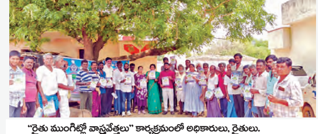
"రైతు ముంగిట్లో వాస్తవతలు" కార్యక్రమంలో అధికారులు, రైతులు.