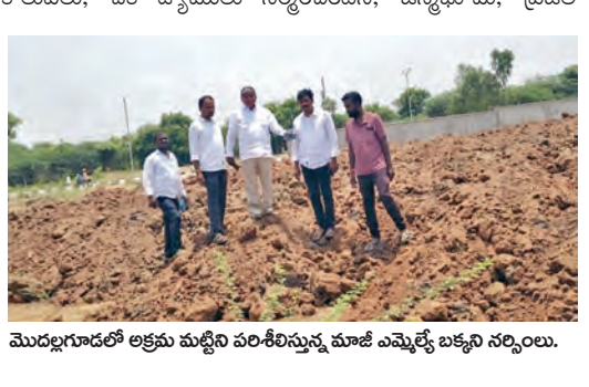
మొదలగూడెంలో లక్షలు మట్టిని పరిశీలిస్తున్న మాజీ ఎమ్మెల్యే బళ్ళని సర్పించి.

వద్దకు పాలన వంటి పథకాలను ప్రవేశపెట్టి ప్రజలకు లబ్ధి